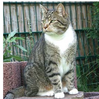
Kater Elvis hatte ungeliebten Besuch.

Na, da war ich aber froh, als alles vorbei war. Das Schöne war: Ein großer Napf voll Tunfisch stand schon bereit . . .